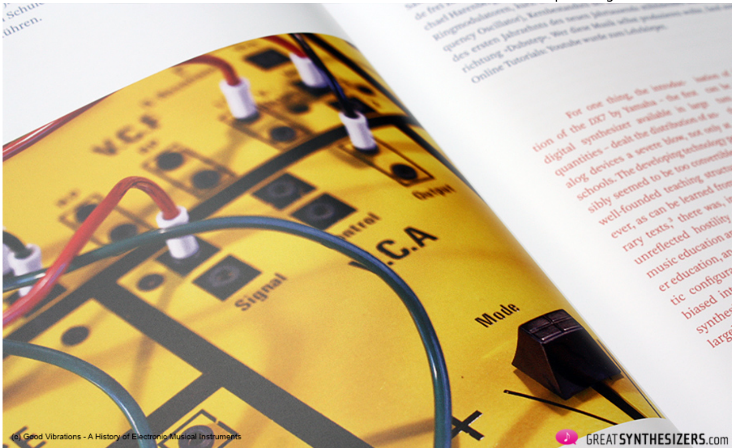
(c) Good Vibrations - A History of Electronic Musical Instruments